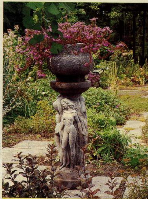
Sculpture romantique, représentant les trois Grâces (chez Art et Jardins). Elle sert de base à un pot de scavéolas.

Contrairement à ce qu'on pourrait croire, les sculptures peuvent passer l'hiver à l'extérieur. Recouvertes de neige, elles prendront des formes inusitées... Si la sculpture africaine est exposée au froid, sa coloration se modifiera et apparaîtra sous une nouvelle patine qui, avec le temps, la rendra encore plus intéressante. Par contre, pour passer l'hiver dehors sans trop de dommages, la matière poreuse de la sculpture moderne exige qu'on la protège en la recouvrant d'une cire.